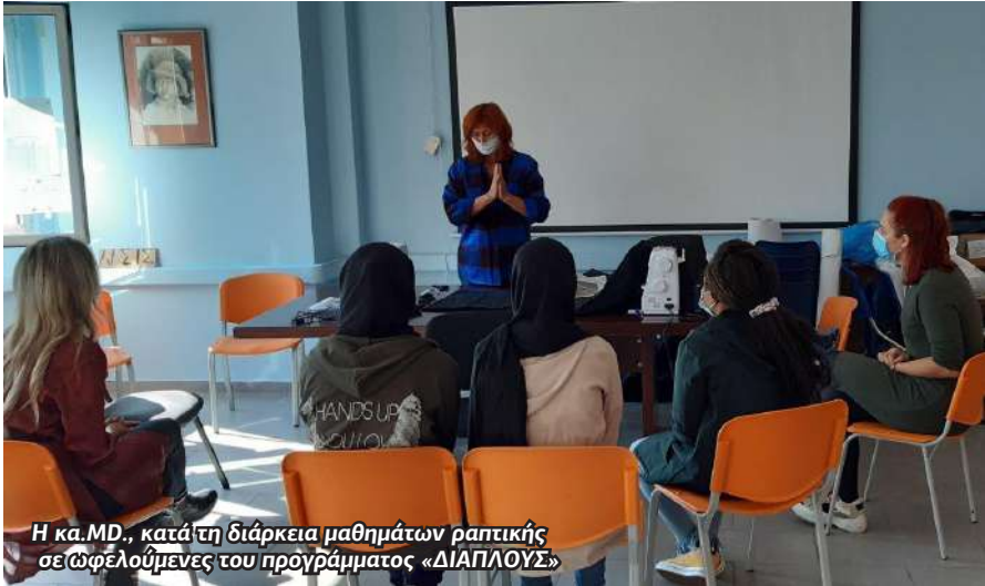
Η κα.ΜΔ., κατά τη διάρκεια μαθημάτων ραπτικής σε ώφελούμενες του προγράμματος «ΔΙΑΠΛΟΥΣ»

λπλα, τα μαθήματα αυτά αποτέλεσαν αφορμή γνωριμίας και αλληλεπίδρασης διαφορετικών ανθρώπων μεταξύ τους, κάτι που κρίνεται ιδιαίτερα πολύτιμο για την πλειοψηφία των ατόμων λόγω των ισχυόντων κοινωνικών συνθηκών. Η Μ.Δ δήλωσε ότι επιθυμεί να δώσει και σε άλλους ανθρώπους ένα κομμάτι από τη σημαντική βοήθεια που ένωσε ότι πήρε μέσα από το πρόγραμμα.