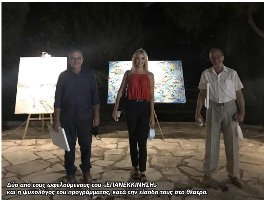
Δύο από τους ωφελούμενους του «ΕΠΑΝΕΚΚΙΝΗΣΗ» και η ψυχολόγος του προγράμματος, κατά την είσοδο τους στο θέατρο.

2 Σε μία προσπάθεια να παρέχουμε στους ωφελούμενους του προγράμματος την ευκαιρία να παραμείνουν κοινωνικά ενεργοί, έχοντας υπόψη μας τις περαιτέρω δυσκολίες που φέρνει στους πιο ευάλωτους συνανθρώπους μας η συνθήκη μιας πανδημίας οργανώσαμε αρκετές κοινωνικές δραστηριότητες. Με την ευγενική χορηγία εισιτηρίων από το Κρατικό Θέατρο Βορείου Ελλάδος, οι εξυπηρετούμενοι του προγράμματος «ΕΠΑΝΕΚΚΙΝΗΣΗ» είχαν την ευκαιρία το καλοκαίρι του 2020 να παρακολουθήσουν τη θεατρική παράσταση «ΟΡΝΙΘΕΣ». Βασικοί στόχοι της δράσης αυτής ήταν η επαφή των ανθρώπων με τα δρώμενα της πόλης και την τέχνη, η κοινωνικοποίηση τους και η ενδυνάμωση των μεταξύ τους σχέσεων και δικτύων.